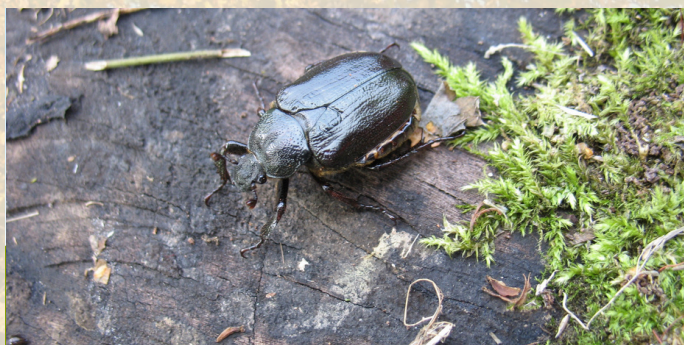
Niūriaspalvis auksavabalis ( Osmoderma barnabita )

Niūriaspalvis auksavabalis – tai Europoje labai retas ir Lietuvoje aptinkamas vabalas. Suaugę vabalai pasiekia iki 3 cm ilgį, kai lervos gali būti net iki 8 cm ilgio. Vabalai dažniausiai renkasi ąžuolus, nors gali būti ir kiti lapuočiai medžiai. Lervos vystosi įsirausios į trūnėjusius kažkur aukštai medžio drevėje apie 3-4 metus ir padeda formuoti buveines ir kitiems gyvūnams, kurie naudojami medžių drevėmis.