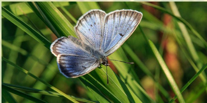
Kraujalakinis melsvys ( Maculinea teleius )

Tai drugiai - gegutės. Jų gyvenimas glaudžiai susijęs su skruzdėlėmis ir specifinėmis buveinėmis, kuriose auga vaistinės kraujalakės ( Sanguisorba officinalis ). Išsiritę vikšrai 2 - 3 savaites liepos mėnesį maitinasi kraujalakių žiedynais. Ūgtelėję vikšrai leidžiasi ant žemės ir pradeda skleisti garsus imituojančius Myrmica genties skruzdėlių motinėlių. Vikšrą suradusi patruliuojanti darbininkė skubiai gabena jį į skruzdėlyną, manydama, kad tai „motinėle“. Tačiau realybėje, ką tik žolėdžiu buvęs vikšras, patekęs į skruzdėlyną pradeda maitintis skruzdžių lervomis. Maskuotė tokia geniali, kad darbininkės ne tik nieko nepastebi, bet dar ir prižiūri, valo ir saugo melsvio vikšrą. Skruzdėlyne jis gyvena apie 11 mėnesių iki kol išsiritą į suaugusį drugį.